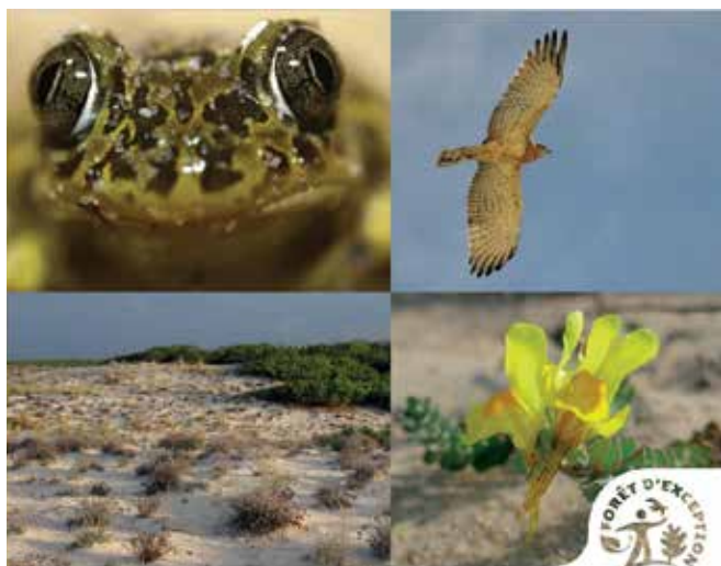
ATLAS DE LA BIODIVERSITÉ DES FORÊTS D'EXCEPTION® DU BASSIN D'ARCACHON

L'ONF, avec le soutien de la Région Nouvelle-Aquitaine et entouré du Conservatoire Botanique National Sud-Atlantique, de la Ligue de Protection des Oiseaux et de Cistude Nature, s'est lancé dans l'édition d'un Atlas de la Biodiversité afin de doter cette Forêt d'Exception d'un réel outil pédagogique. Ce document, à destination de tous, aide à connaître les espèces et les habitats naturels, pour mieux les préserver. Il présente aussi les modes de gestion conservatoire mis en place par les forestiers et les bons réflexes à adopter lorsque l'on s'aventure sur le littoral sableux. Cette exposition photographique met en valeur les espèces naturelles (faune et flore) emblématiques que l'on retrouve dans ces paysages uniques.